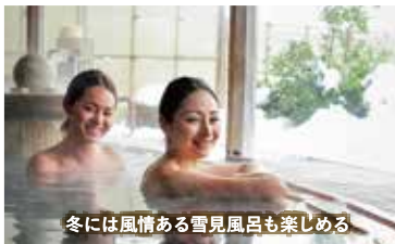
冬には風情ある雪見風呂も楽しめる