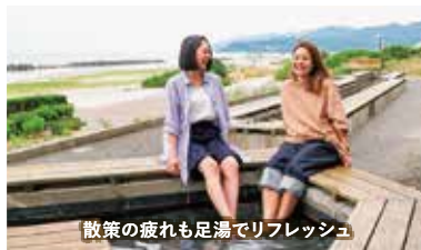
散歩の疲れも足湯でリフレッシュ