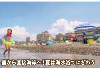
宿から直接海岸へ!夏は海水浴でにぎわう